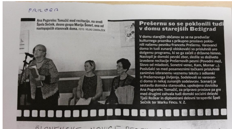
slika v Novicah in tekst

Ocena prireditve in odmevnost je bila objavljena v Slovenskih novicah 9. februarja in jo je pripravil novinar g. Vojko Zakrajšek.