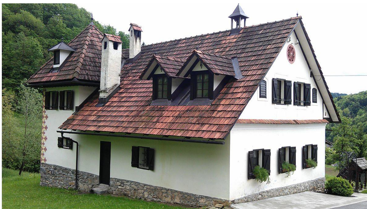
Prenovljena rojstna hiša Cankarjeve matere na Vrzdencu blizu Horjula.